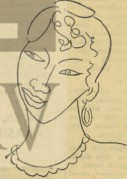
Matisse: Gravür, zenci kadın